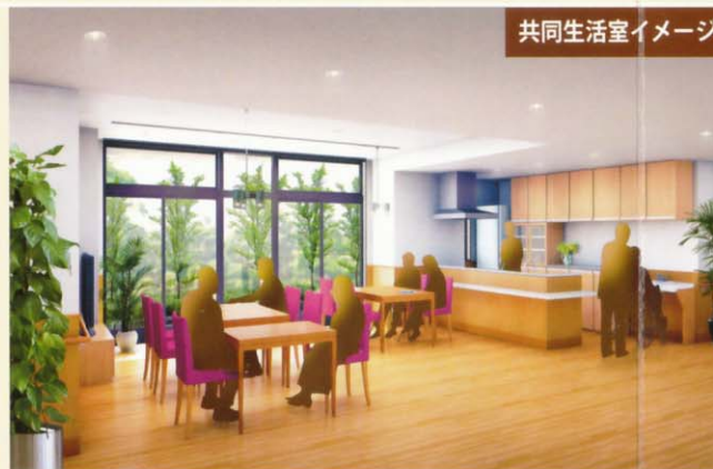
共同生活室イメージ